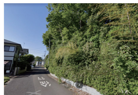
工事着工前

ある日突然、伐採・抜根されて丸裸の緑地に。補助金申請の虚偽記述と、職員による設計図の書き換えが発覚!